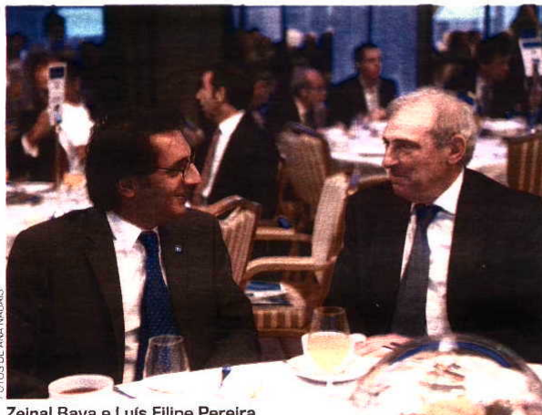
Zeinal Bava e Luís Filipe Pereira