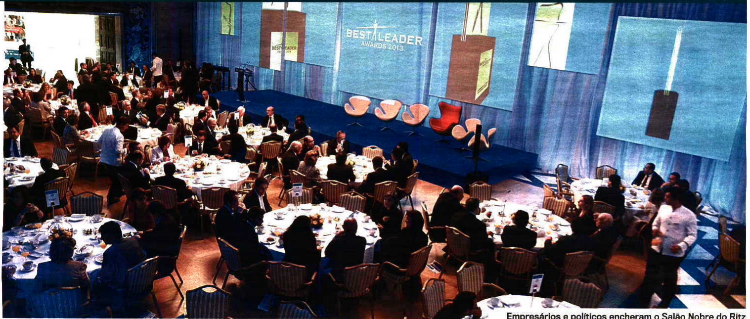
Empresários e políticos encheram o Salão Nobre do Ritz